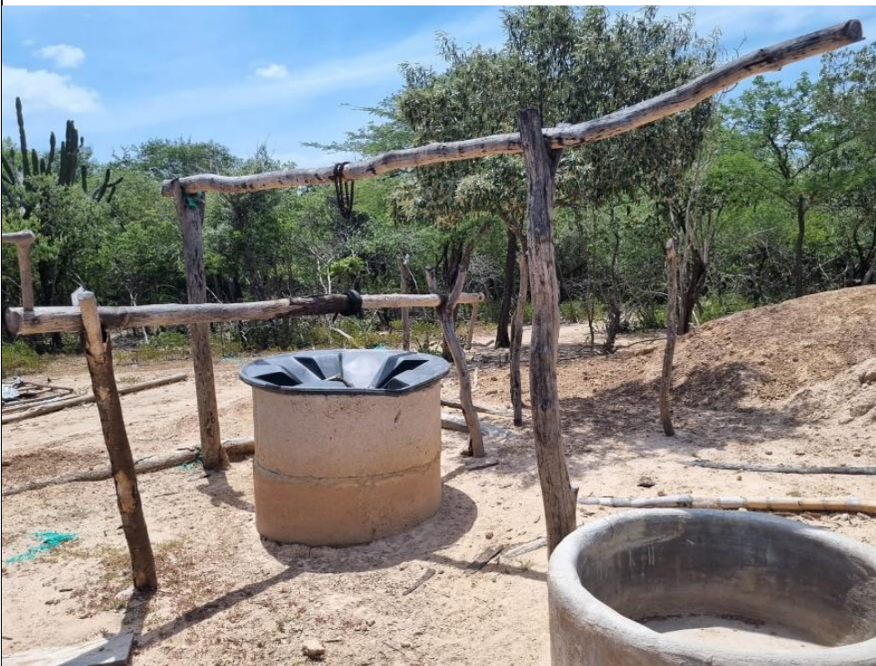
55.2 Pozo artesanal anillado 2 Coordenadas: N 11°23'23,0" - W -72°42'45,6"