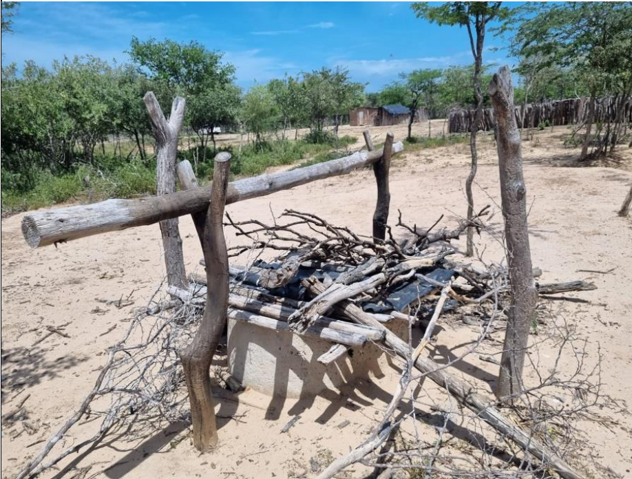
55.3 JAGUEY Coordenadas: N 11°23'21,1" - W -72°42'48,3"